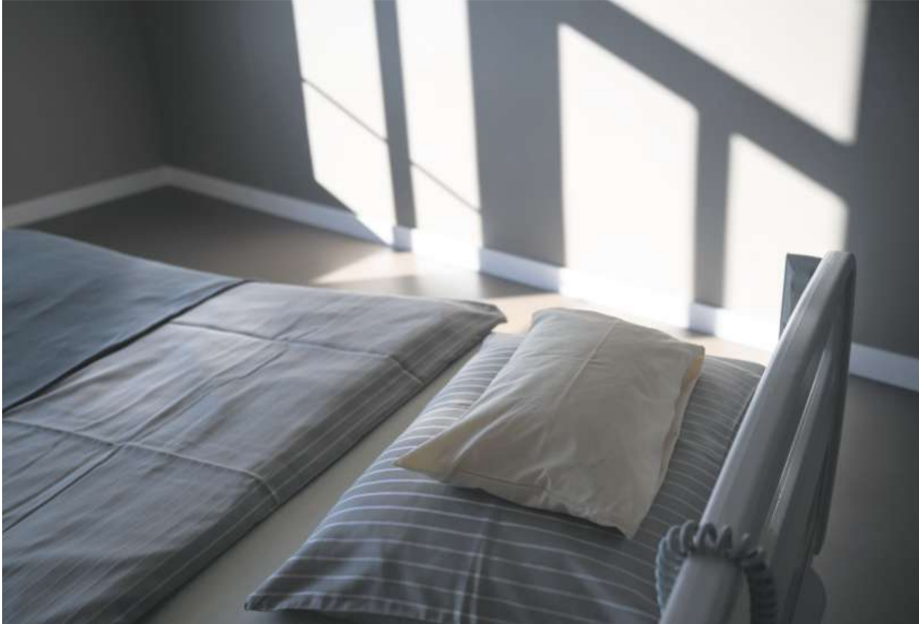
Die Anordnung bewegungseinschränkender Massnahmen bei Betten sei problematisch, stellte die Kommission bei einem Besuch des Alterszentrums Sunnepark in Egerkingen fest (Symbolbild).